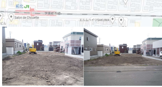
現況と図面が異なる場合は現況を優先いたします。