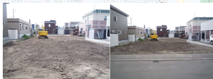
現況と図面が異なる場合は現況を優先いたします。