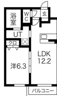
B-TYPE (42.22㎡) LD9.8*2.4K*6.3