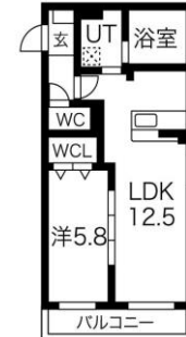
A-TYPE (43.24㎡) LD10.1*2.4K*5.8